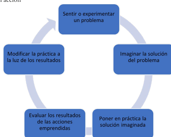
Fig. 1. Ciclo de la investigación acción

Nota: Los cinco pasos del ciclo de la investigación acción. Elaboración propia. Etapas tomadas de Whitehead (1989) citado por Latorre (2005, p. 38)