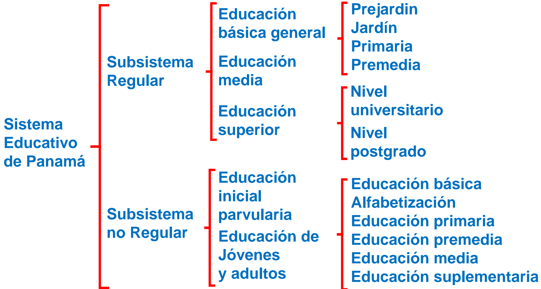
Estructura académica del sistema educativo de Panamá

http://www.capital.com.pa/meduca-resalta-logros-de-la-transformacion-curricular/